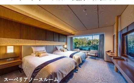
スーパーリアノースルーム